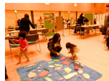
保育ボランティア「くれよん」による遊びコーナー