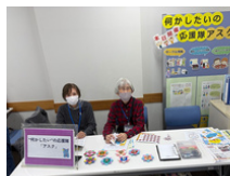
“何かしたい”の応援隊「アスク」