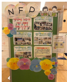
指定管理者の紹介パネル

市民館のお隣り、かわさき市民活動センター主催の川崎市の市民活動見本市「ごえん楽市」に市民館で活動するボランティアのみなさんと参加しました。会場提供に留まらず事前の企画・準備から参画し、たくさんの方と交流できました！